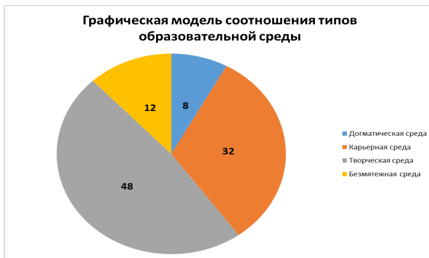
Рис. 5. Диаграмма соотношений типов образовательной среды гимназии (2021 г.)

Карьерная и творческая образовательная среда, способствует свободному развитию активной жизненной позиции личности учащегося.